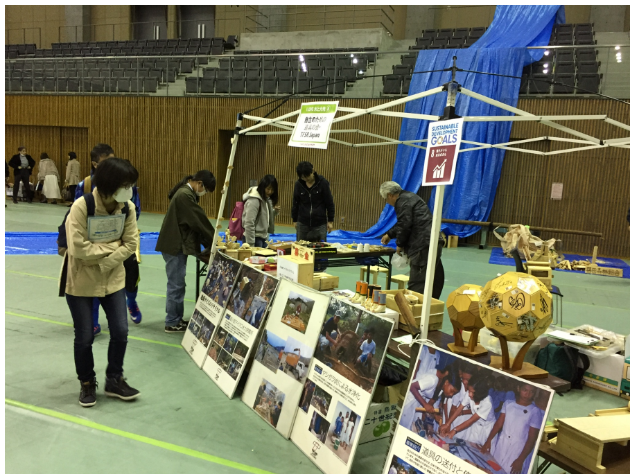
We Love とよた フェスティバル ブースにて (2019/3/17)